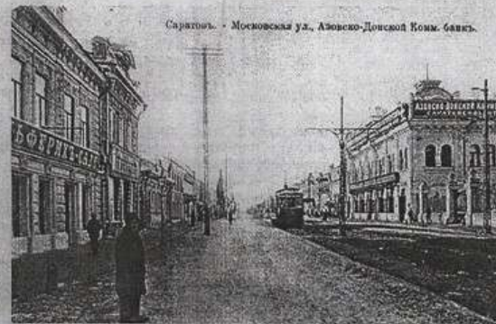
Саратов. - Московская ул., Азовско-Донской Коим. башня.