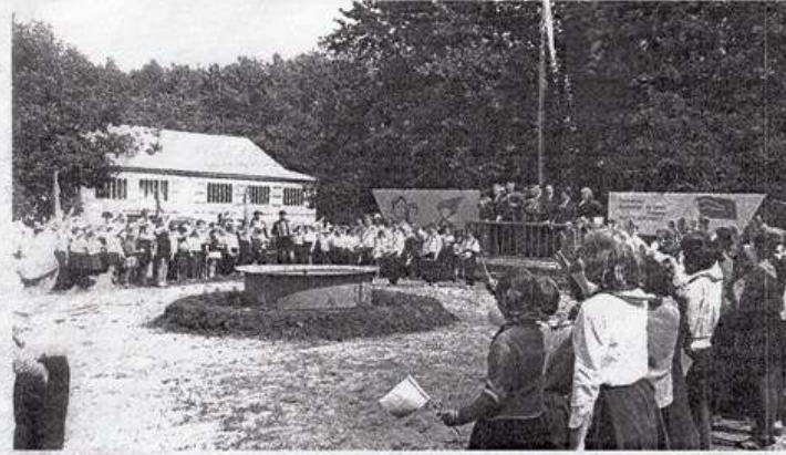
Посещение чехословацкой делегации пионерского лагеря «Огонёк»

Орловское также посещала делегация из далёкой республики Куба. Именно в это время в селе разворачивается строительство новых жилых домов как на средства сельчан, колхоза, так и по линии государства.