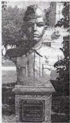
Герой Советского Союза — Вольдемар Карлович Венцель

С осени 1942 г. до осени 1943 г. в селе строго соблюдалась ночью светомаскиров-