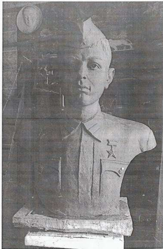
Бюст Героя Советского Союза Венцеля (Венцель) Валентины Курловича из деревни «Борис