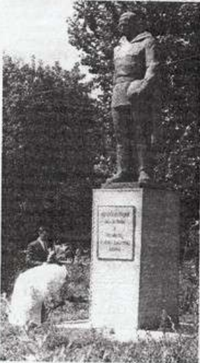
Орловские молодожёны возлагают цветы к памятнику «Бшим на войне односельчанам»

В заголовке леса принимали участие сызранские и симбирские крестьяне. А строили непосредственно первые дома из деревянного теса хвалынские, польские и воскресенские крестьяне. И не только Орловское, но и все