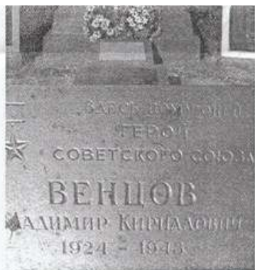
Памятник Герою Советского Союза Владимиру Кирилловичу Венцову (Вольдемару Карловичу Венцелю) установлен на территории Украины, в с. Вишнёвое Репкинського района Черниговской области

званием Героя Советского Союза в годы Великой Отечественной войны был удостоен уроженец Республики немцев Поволжья старший лейтенант Р. Клейн , который в 30-х годах 20 века учился в Маркштадтском механическом техникуме. В годы войны он был и танкистом, и партизаном, и подпольщиком, проявлял мужество и отвагу. Ему удалось выжить, хотя был тяжело ранен.